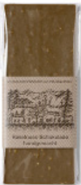
Art. C2603 HASELNUSS MILCH 100g