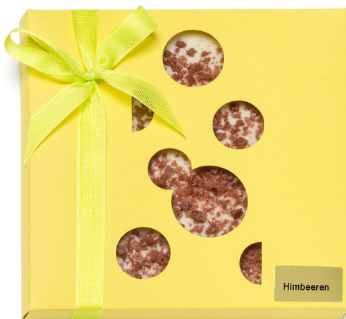
Art. C2722 BIO HIMBEER WEISS 80g