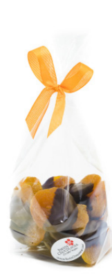
Art. C2632 APRIKOSEN MIT DUNKEL SCHOKOLADE 150g