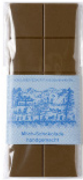
Art. C2600 MILCH 100g