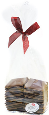
Art. C5109 BIO NOUGAT PLÄTTLI M.CHOC MILCH/DUNKEL 180g