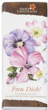
Art. C2704 BLÜTEN/MALVE/APFEL 66g