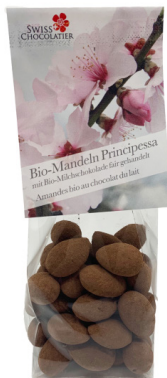
Art. C2652 BIO PRINCIPESSA MANDELN MILCH 110g