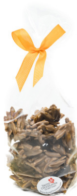
Art. C2637 BIO MANDEL ROCHER MILCH 150g