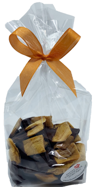
Art. C2630 BIO MANGO MIT DUNKLER SCHOKOLADE 100g