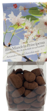
Art. C2653 BIO PRINCIPESSA MANDELN DUNKEL 110g