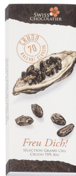
Art. C2706 CRUDO 70% 60g