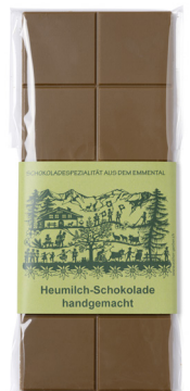
Art. C2590 HEUMILCH (NICHT BIO) 100g