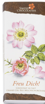
Art. C2702 ROSENBLÜTEN 66g