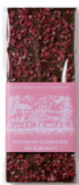
Art. C2608 HIMBEER DUNKEL 100g