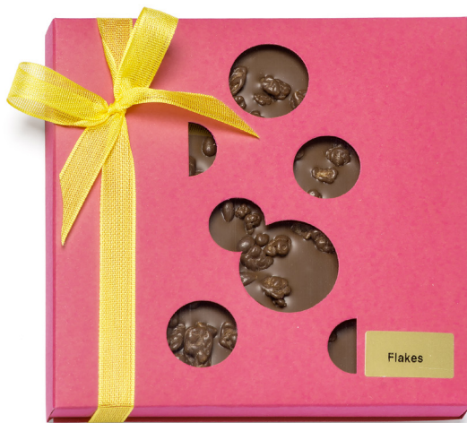
Art. C2720 BIO FLAKES MILCH 80g

Die Bio Quadro Tafeln eignen sich ideal zum Schenken, Verschicken oder als «Mitbringsel». Die farbenfrohen Tafeln mit den Emmentaler Käselöchern werden mit feinsten Couverture von Hand hergestellt.