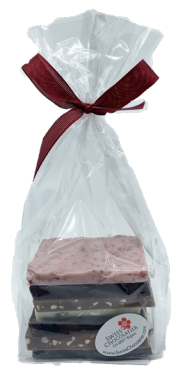
Art. C5114 BIO FRISCHESCHOKOLADE 130g