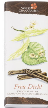
Art. C2703 ZIMT/LINDENBLÜTEN 66g