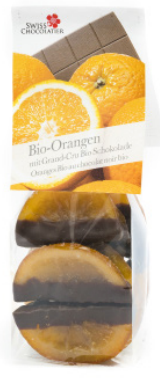
Art. C2660 BIO ORANGEN MIT DUNKLER SCHOKOLADE 110g