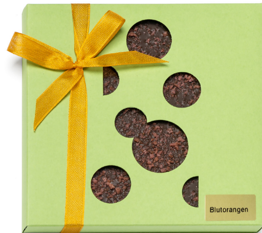
Art. C2721 BIO ORANGEN DUNKEL 80g