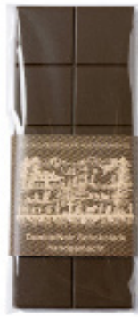
Art. C2601 DUNKEL 100g