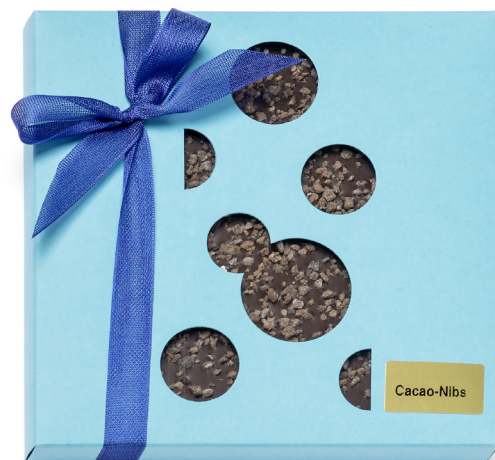
Art. C2723 BIO CACAO NIBS DUNKEL 80g