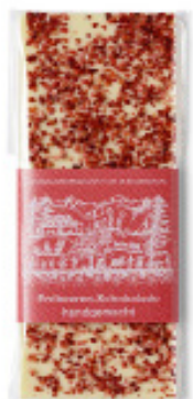
Art. C2609 ERDBEER WEISS 100g