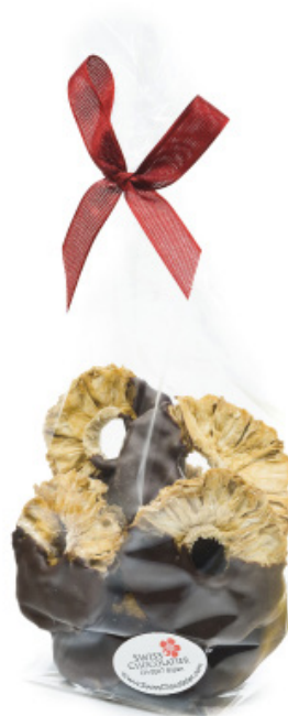
Art. C2633 BIO ANANAS MIT DUNKLER SCHOKOLADE 100g