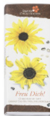
Art. C2705 SONNENBLUMEN 66g