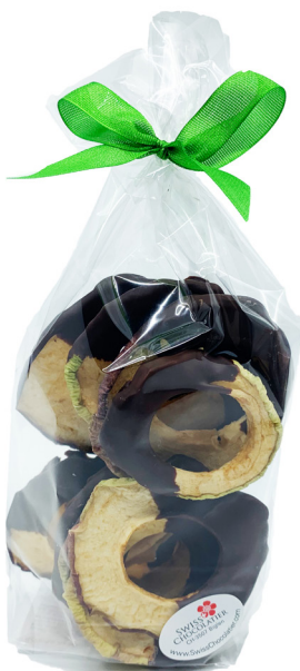
Art. C2635 BIO APFELRINGE MIT DUNKLER SCHOKOLADE 100g