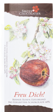
Art. C2712 BERNER ROSEN ALKOHOL 66g