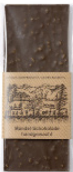
Art. C2604 MANDELN DUNKEL 100g