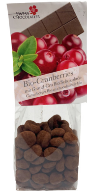
Art. C2629 BIO CRANBERRIE MIT DUNKLER SCHOKOLADE 110g