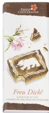
Art. C2709 LEBKUCHEN 66g