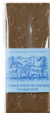
Art. C2605 BREZELI MILCH 100g