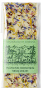
Art. C2606 HEUBLUMEN WEISS 100g