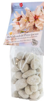
Art. C2654 BIO PRINCIPESSA MANDELN WEISS