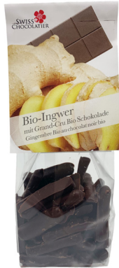
Art. C2634 BIO INGWER MIT DUNKLER SCHOKOLADE 110g

Darfs was Gesundes sein? Ingwer, Orangen und Cranberries sind fruchtig und gesund, kandiert und mit Schokolade ummantelt. Eine süsse Versuchung für Feinschmecker. Oder doch lieber unser «Brönnts» mit vier verschiedenen Schnäpsen aus dem Emmental?