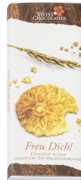
Art. C2707 BREZELI 66g