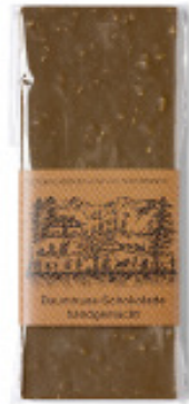
Art. C2602 BAUMNUSS MILCH 100g