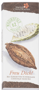
Art. C2708 MADIROFOLO 62% 60g