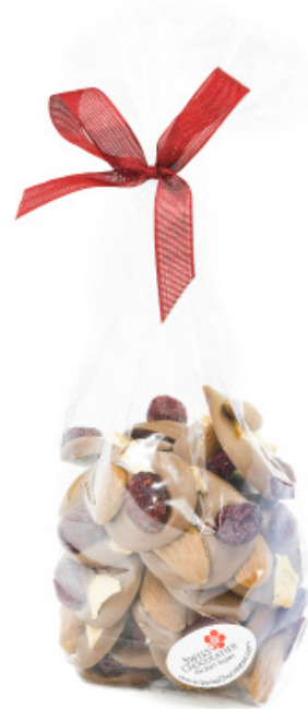
Art. C2639 BIO PICNIC MIT TROCKEN- FRÜCHTEN 180g