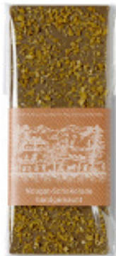
Art. C2607 NOUGAT MILCH 100g