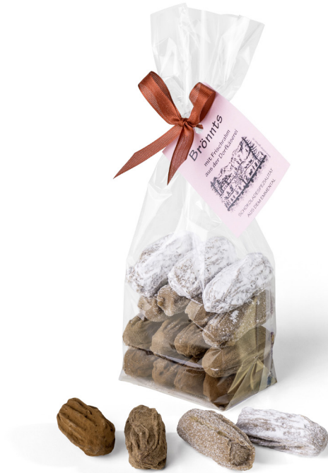
Art. C1200 BRÖNNTS US EM AEMMITAL RAHMSTÄNGELI ASSORTIERT Kirsch/Aprikosen/Pflümli/Zwetschgen 180g