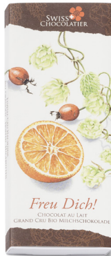
Art. C2701 ORANGEN/HOPFEN/ HAGEBUTTEN 66g

Die FreuDich Tafeln bescheren freudige Momente nach Freudiger's Art. Die Tafeln werden mit verschiedenen Blüten- und Kräuteraromen hergestellt und sehen im Innern dem «Ämmtaler» Käse sehr ähnlich. Lassen Sie sich überraschen.